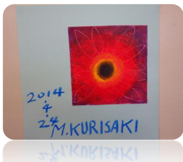
ガーベラの観察画

☆アートの時間（月 1 回）では、アートプログラムに沿ってユニークな作品作りに挑戦しながら、脳の活性化につなげています。