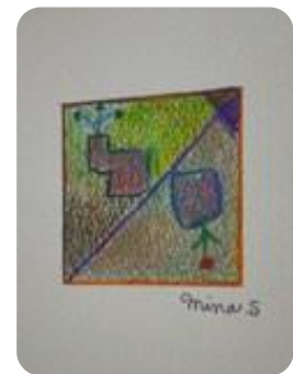
ポストカード・美しい色面