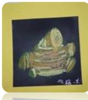
しょうがの量感画