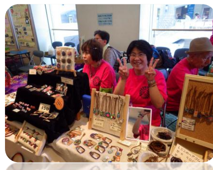
多摩ふれあいまつり