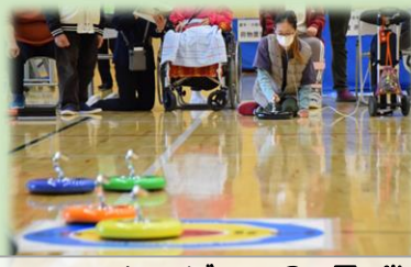
カローリング大会優勝！