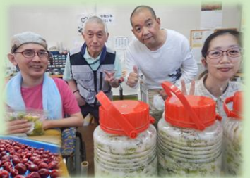
梅干しプロジェクト

笑顔が戻ってきたこの一年。たくさんの活動をする事が出来ました。みんなで料理も解禁！夕ワ焼きパーティーも計画中！近隣へのお散歩も増え、活動範囲も広がりました。そろそろ車椅子が連なって移動することもあり、地域の方々に存在感をアピール！声をかけてくれる方も増えました。感謝！