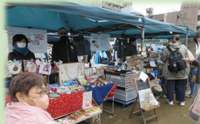
外出する機会も増えました。