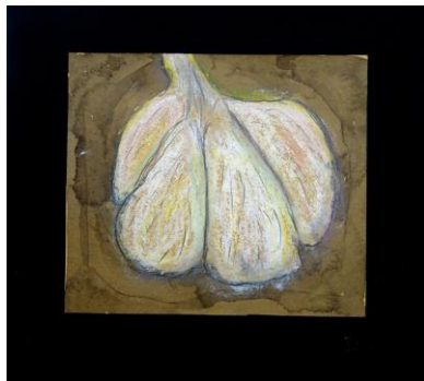
<にんにくのネガポジ画>