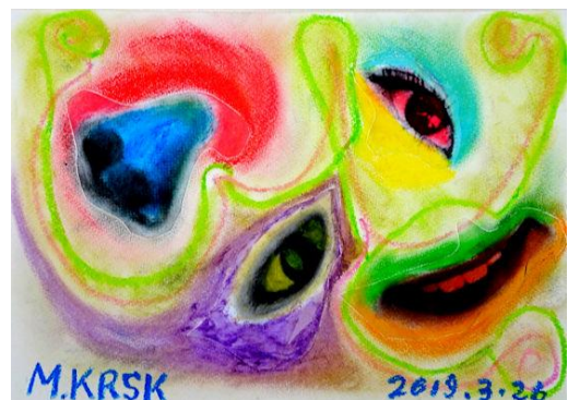
<おもしろい顔> コラージュクロッキー画