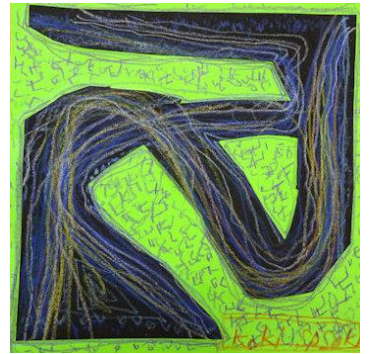
<フォルメンパズル>